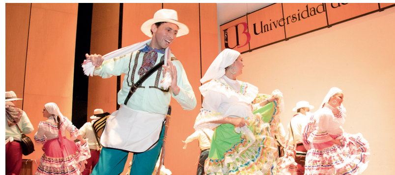
Festival Danza Viva, sede Tunja

Con delegaciones de distintos municipios de Boyacá, se llevó a cabo el Festival Intercolegiado “Danza Viva” en su XXI edición. Más de 150 artistas de los distintos colegios participantes y estudiantes de la Universidad de Boyacá, presentaron en las sedes Tunja y Sogamoso, muestras del folclor colombiano y danza moderna. Con esta actividad, que fomenta los buenos valores y el sano aprovechamiento del tiempo libre, se ha promovido durante más de dos décadas la integración estudiantil de las instituciones educativas del oriente colombiano.