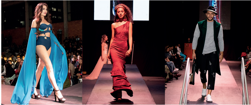
Modelos desfilando las creaciones de los estudiantes de Diseño de Modas de la Universidad de Boyacá

Este evento, único en el departamento, se ha consolidado como un escenario para la exhibición del talento, ingenio y creatividad evidenciada en los diseños de los estudiantes del programa de Diseño de Modas. La octava edición del Tunja Fashion se realizó el 10 de octubre en el coliseo de la Universidad de Boyacá. El evento contó con la asistencia de 500 personas, quienes se deleitaron con colecciones inspiradas en los hechos históricos ocurridos de 1810 a 1819. En esta versión que presentó la temporada: Primavera – Verano y participaron modelos profesionales, quienes desfilaban atuendos de los talleres: femenino, vestidos de baño, vestidos de gala, taller infantil, estudiantes destacados y taller de profundización en joyería. El desfile tuvo el acompañamiento de diseñadoras nacionales invitadas.