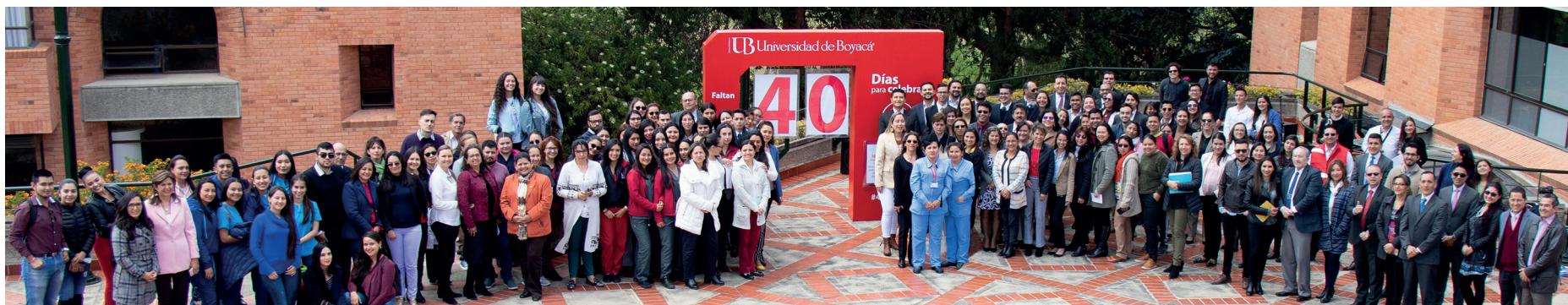
La comunidad universitaria se reunió en la plazoleta principal para la inauguración del contador de historias Universidad de Boyacá 40 años