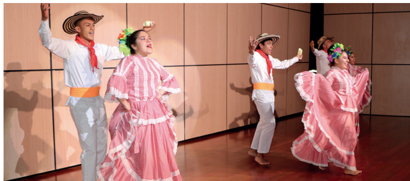
Festival Danza Viva, sede Sogamoso