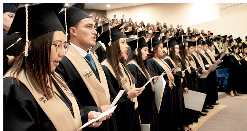
Ceremonia de graduación 40 años, sede Tunja

Las directivas de la Institución presidieron la ceremonia de graduación en este segundo semestre, en la cual otorgaron el título de profesionales, especialistas y magísteres, a 598 nuevos embajadores de la Universidad de Boyacá, quienes lideran la nueva generación como graduados de la promoción 40 años - Universidad de Boyacá. Este evento permitió a los titulados, familiares y amigos, unirse en una celebración llena de alegría e inmenso orgullo, gracias al resultado de este nuevo triunfo académico que representa un nuevo compromiso con la sociedad.