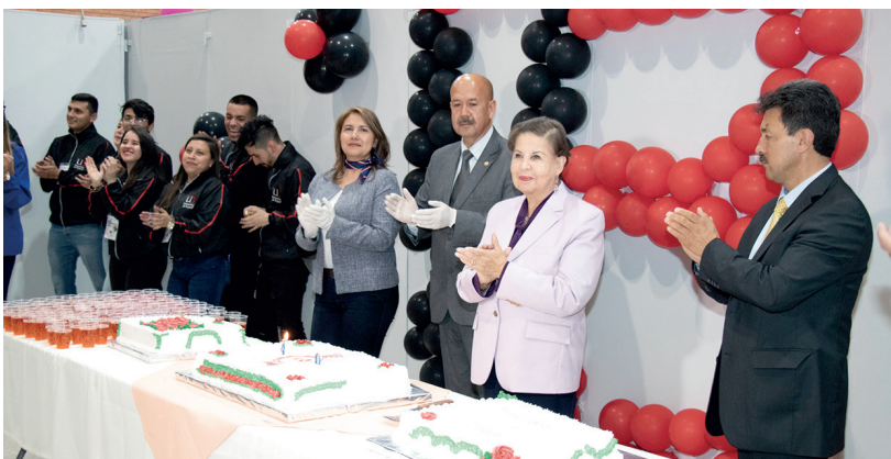
Inauguración de la XXVI Feria Empresarial

Con más de 3.000 visitantes y la participación de 100 empresarios de Boyacá y de otros departamentos, transcurrió la XXVI Feria Empresarial de la Universidad de Boyacá, la cual propende por el fortalecimiento empresarial de la región. En esta edición, realizada entre el 18 y el 20 de septiembre, la feria contó con la participación de sectores: agroindustrial, turístico, financiero, automotriz, industrial, artesanal, de tecnología, manufacturero, seguridad, industrial, construcción, gastronomía y educación.