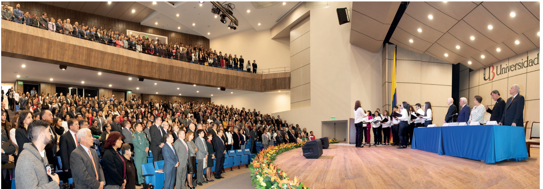
Intervención del coro de la Universidad durante el Acto Académico de Aniversario

universidad de alta calidad. Los 18.108 profesionales a nivel de pregrado, especializaciones y maestrías, que hemos formado, son un testimonio vivo de nuestro esfuerzo.