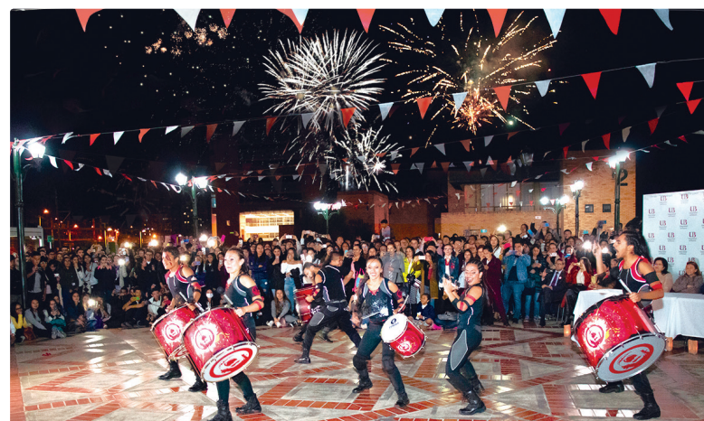
Batucada Aainjaa en la Universidad de Boyacá