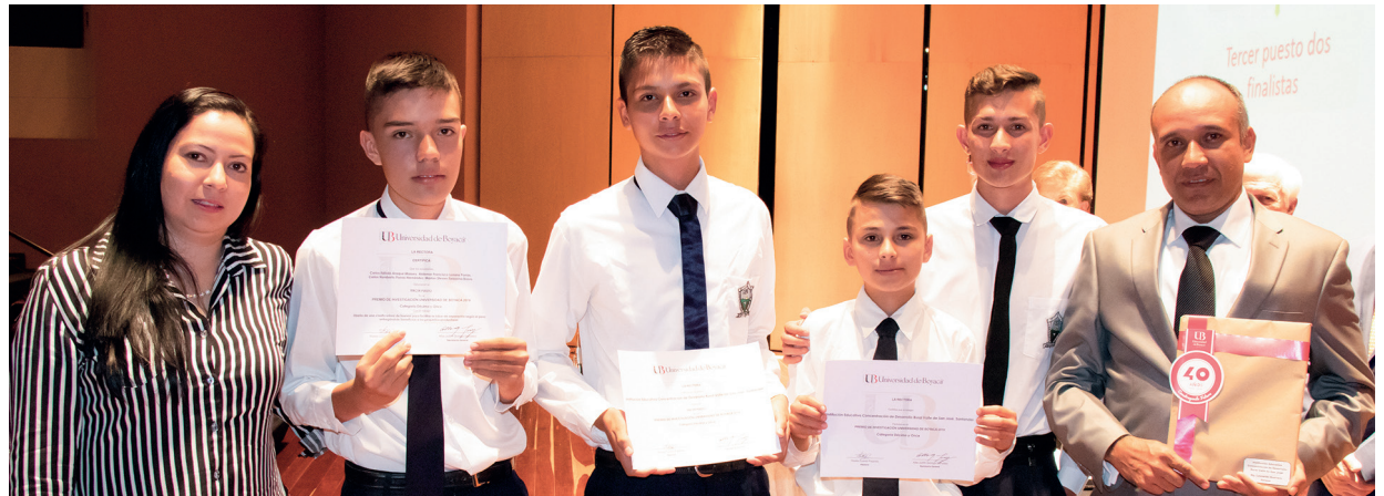
Docentes y estudiantes de la Institución Educativa Concentración de Desarrollo Rural, Valle de San José - Santander.