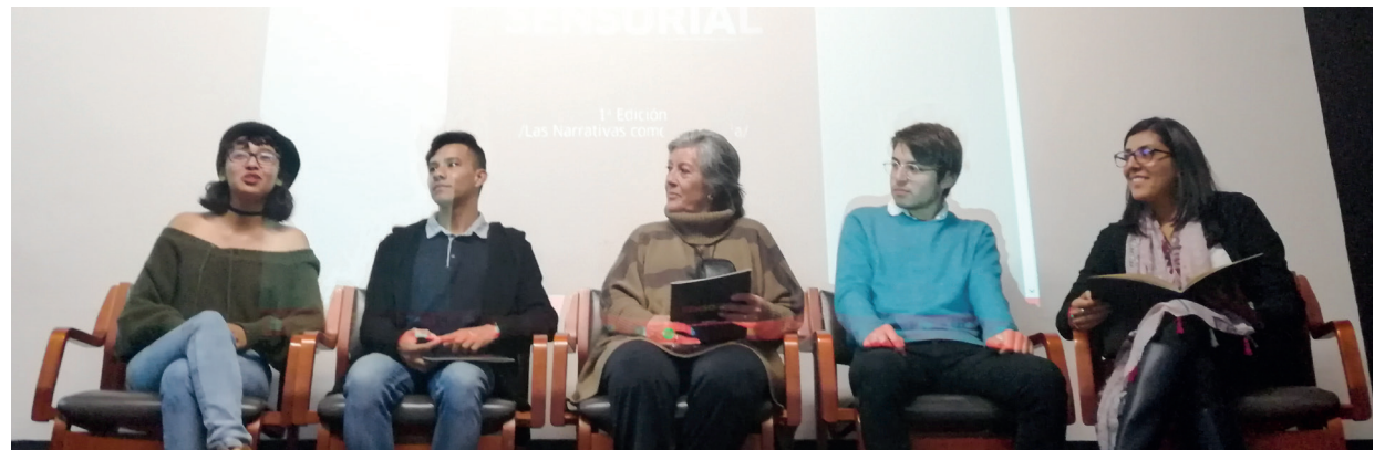
Estudiantes Universidad de Boyacá e integrantes de Todaos Boyacá en la Casa de la Mujer en Tunja

El objetivo de la investigación se concentra en emplear las narrativas como una estrategia para divulgar y reconocer los derechos de la comunidad LGBTI en Tunja. Desde el comienzo, el grupo de trabajo se complementó con los integrantes de Todaos Boyacá y el escenario para la realización de talleres fue la Casa de la Mujer en Tunja, y la metodología usada