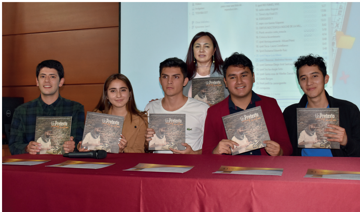
Durante la celebración se realizó un conversatorio sobre el lanzamiento de la Revista UnPretexto

Además de lo anterior, los estudiantes de in-