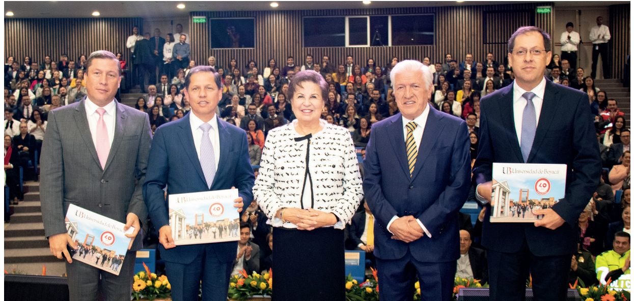
Presentación del libro 40 años durante el acto académico 2019

El cuarto gran logro tiene que ver con los esfuerzos que hemos hecho para asegurar la más alta calidad de nuestros egresados. A lo largo de los años hemos venido tomando decisiones académicas muy importantes para garantizar la calidad de nuestros egresados, modificando el sistema de evaluación para que fuera permanente, introdujimos en el reglamento estudiantil la exigencia de un mínimo de rendimiento académico, exigimos exámenes de grado para todos los programas 20 años antes de que se establecieran oficialmente los exámenes Saber Pro, obligamos a presentar prueba de conocimientos en otro idioma para poderse graduar, así como realizar un semestre de práctica profesional. De la misma manera hemos hecho un gran esfuerzo por tener profesores de las más altas calidades humanas y profesionales.