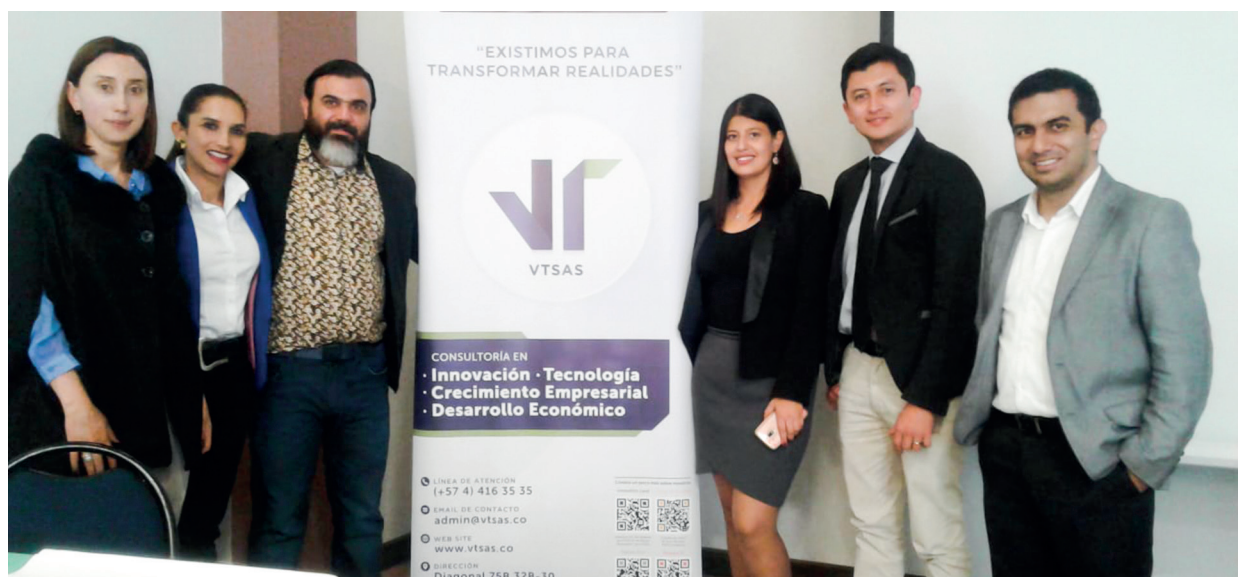
Entrenamiento en Vigilancia Tecnológica