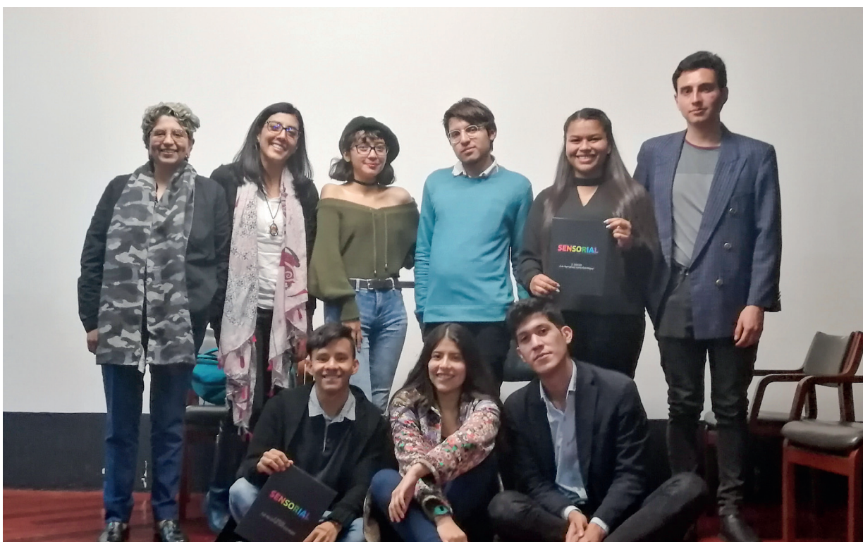
El resultado de la investigación se presentó en la casa museo Gustavo Rojas Pinilla

La Universidad de Boyacá le ha apostado a un modelo pedagógico pensado desde la complejidad, y ha definido e impulsado la política de inclusión que se centra en el reconocimiento y el respeto por la dignidad humana. Desde las diferentes disciplinas académicas es posible reconocer la unidad y la complejidad del ser humano, en este caso la literatura, el audiovisual, el periodismo narrativo... evidencian la unión indisoluble entre la unidad y la diversidad de todo lo que es humano. Esta investigación revela la urgente necesidad de estudiar las causas de las segregaciones, del racismo, las xenofobias y la homofobia; esto contribuiría a establecer bases más sólidas y seguras en el ideal de una educación para la paz.