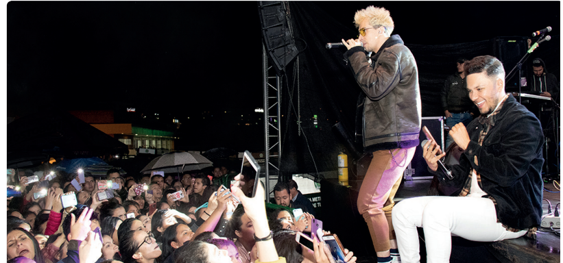
Concierto con Pasabordo en el aniversario de la Universidad de Boyacá

La comunidad universitaria disfrutó del concierto en honor a los estudiantes con la agrupación colombiana Pasabordo, quienes interpretaron sus éxitos que los dieron a conocer en la industria musical, así como sus temas más recientes, que fueron coreados por todos los asistentes de esta institución. El evento, que rindió un sentido homenaje a los estudiantes de esta Universidad, se llevó a cabo en el campus deportivo de la sede Tunja el pasado 18 de octubre. Un reconocimiento especial a la Rectoría y a la Vicerrectoría de Desarrollo Institucional de la Universidad de Boyacá, quienes organizaron este importante evento.