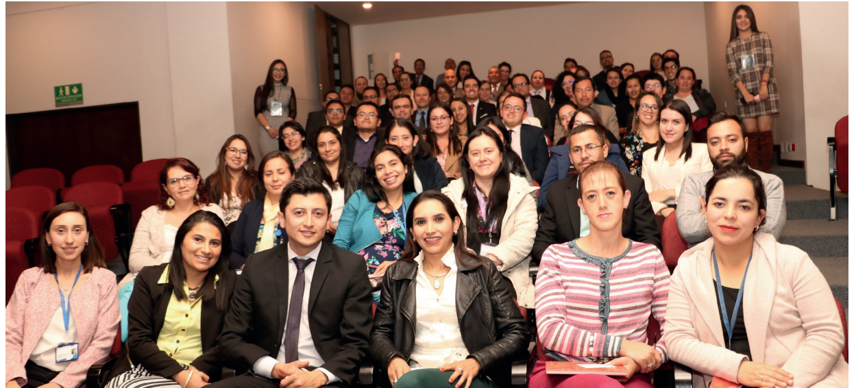
Socialización Evento UB INN Sede Tunja

Las empresas mencionadas trabajan en el programa de la Gobernación de Boyacá denominado "Innovación + País Boyacá", el cual consiste en ofrecer un mecanismo para la transferencia de conocimiento en procesos de innovación, permitiendo la generación de