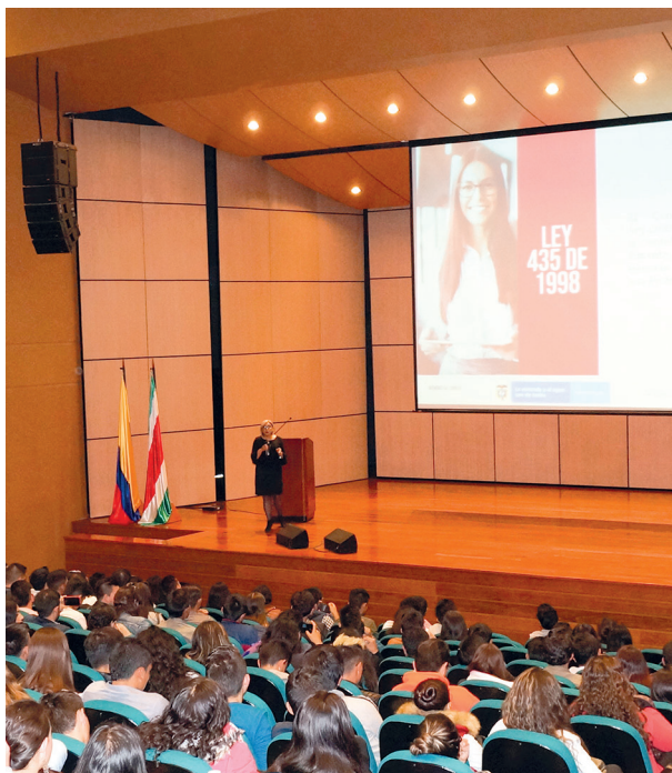
Parainfo Universidad de Boyacá Sede Sogamoso

Recientemente, en el ejercicio de su actividad, la entidad visitó la Universidad de Boyacá en sus sedes Tunja y Sogamoso, la cual desarrolla acciones para que los jóvenes que estudian arquitectura amplíen su conocimiento sobre el